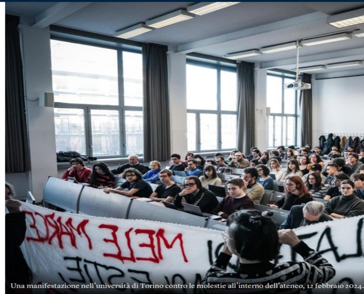
Una manifestazione nell'università di Torino contro le molestie all'interno dell'ateneo, 12 febbraio 2024.

https://www.internazionale.it/reportage/annalisa-camilli/2024/04/10/molestie-universita-violenza-di-genere